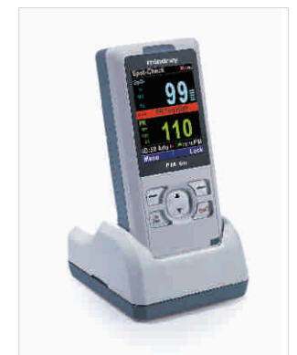
Stand de Carga