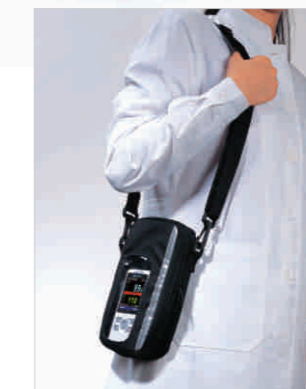
Caja de Transporte